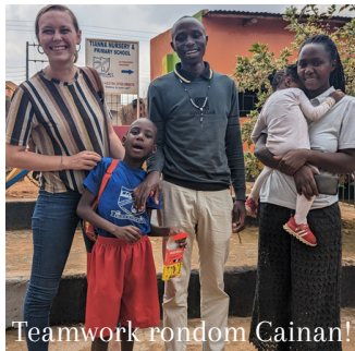
Teamwork rondom Cainan!