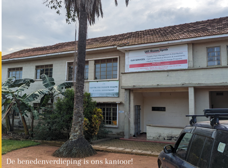
De benedenverdieping is ons kantoor!